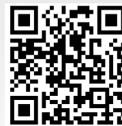
Video: Fußweg S-Hammerbrook