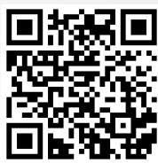
Video: Anfahrt aus der Hafencity