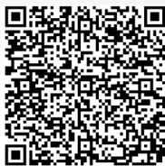
Anfahrt mit Google Maps